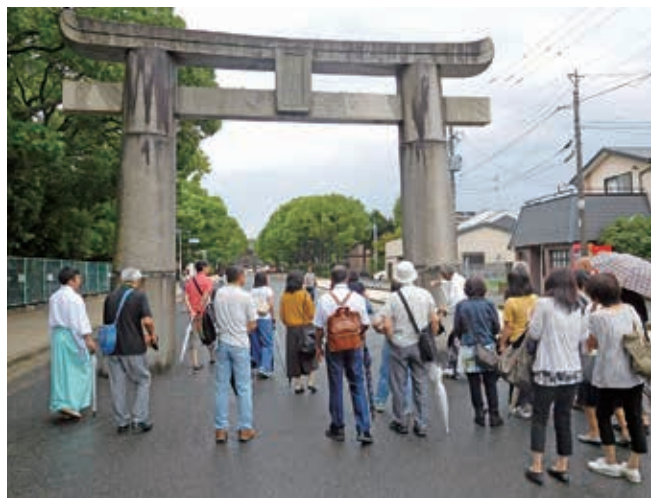
▲第7回「筥崎宮の歴史と文化」