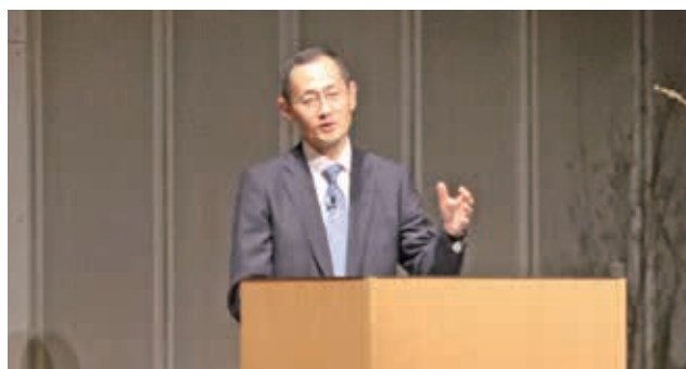
▲熱心に語られる山中伸弥先生