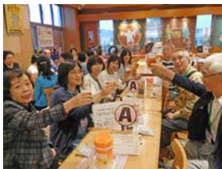
▲第8回「ビールを飲んで、文化を味わう」