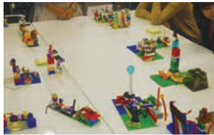
▲レゴブロックを使ってストーリーを紡ぐ