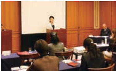
受講生による自己宣誓 「自身が目指すトップリーダーとアクションプラン」