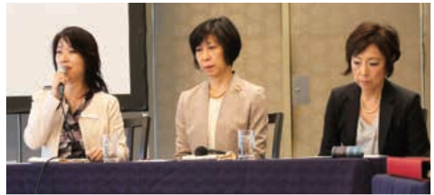
トークセッション「女性トップリーダーとしての生き方について学び考える」