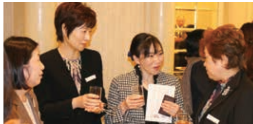
産学官トップリダーとの 意見交換会、交流会（夕食会）