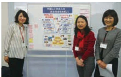
▲ポスターセッション