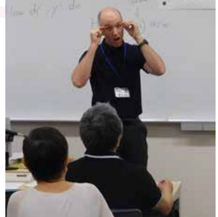
▲第3回 [Learning English through Confident Speaking]