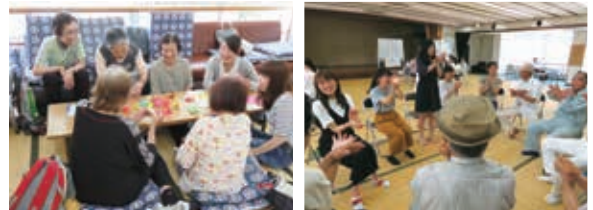
▲ 東香園来園者との交流（1年生）

本学では、学生や教職員が大学近隣の福祉施設等を訪問させていただき、交流を深めています。