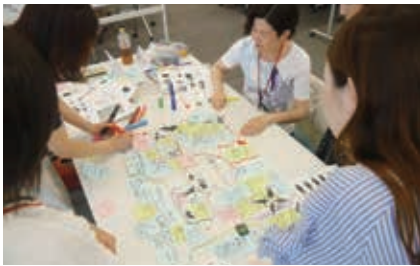
▲「ステークホルダーマップ」で物事を具体化