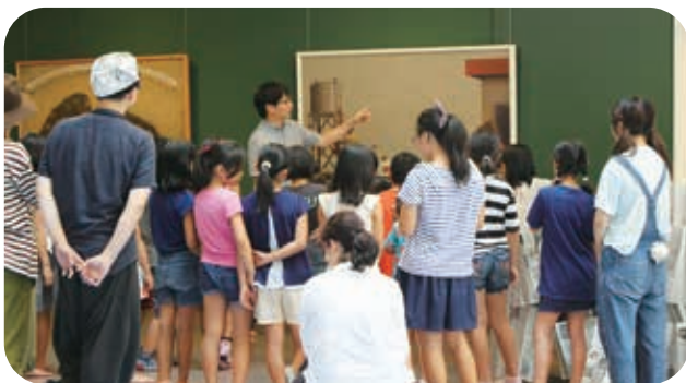
▲美術館にある絵画の中から演劇にする作品を選ぶ様子

子どもたちが美術作品から物語をふくらませ、演劇で表現しました。劇で使う小道具も自分達で作り、最後はグループごとに全員の前で発表しました。子どもたちの笑い声の飛び交う賑やかな一日となりました。