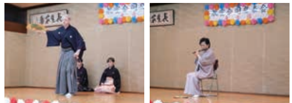
▲ 東香園合同発表会への出演（教員・学生）