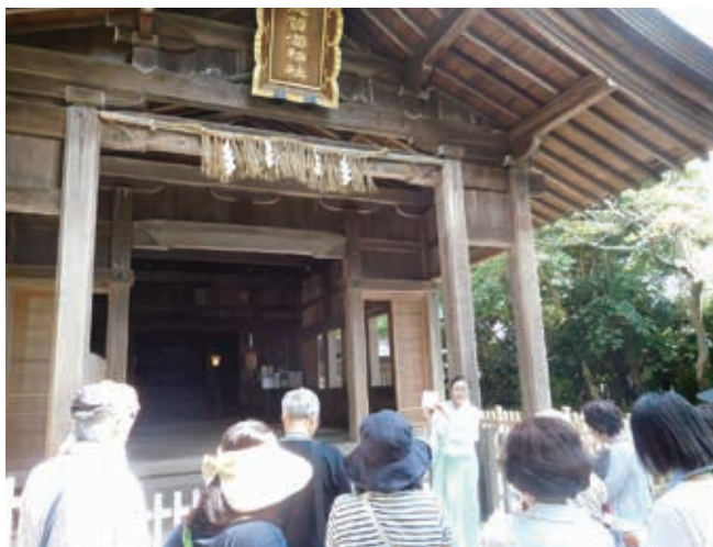
▲第6回「志賀海神社の歴史と文化」