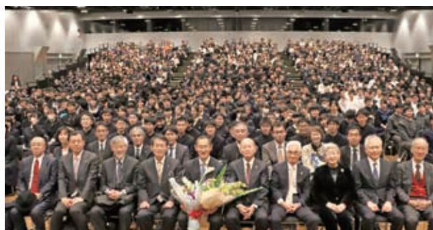
▲会場の皆さんと集合写真