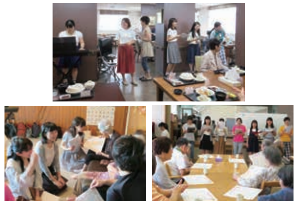
▲ 合唱同好会七夕コンサート