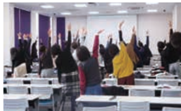
▲アクティブレスト実演