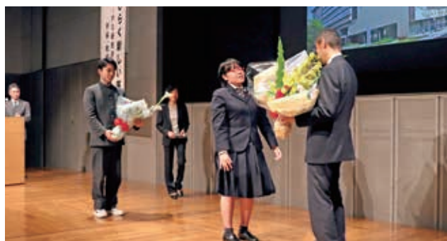
▲高校生による花束贈呈とお礼の言葉