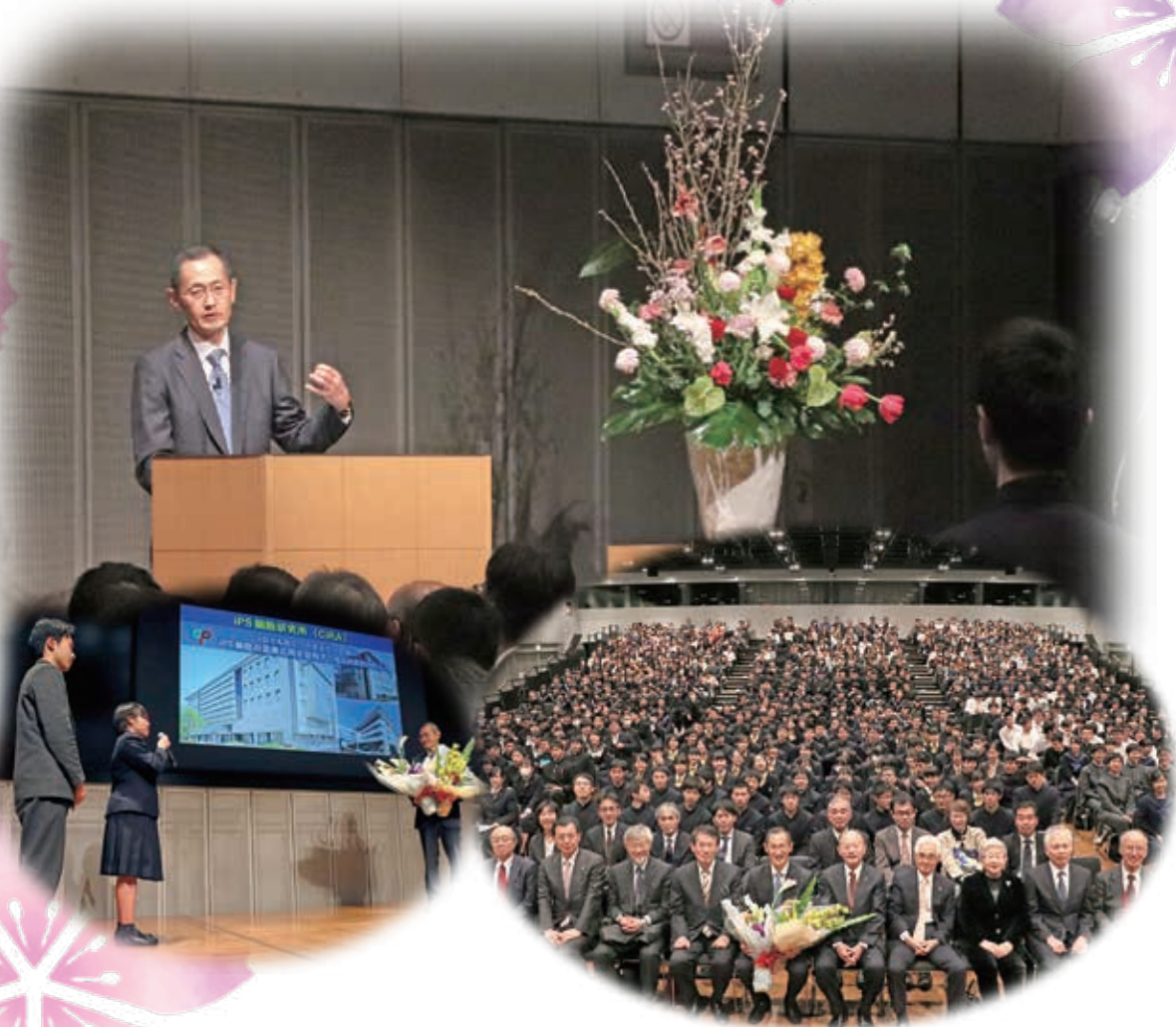
ノーベル賞受賞記念講演会「iPS細胞がひらく新しい医学」山中伸弥先生 平成30年3月5日