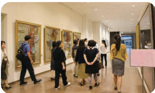
▲コーディネーターの誘導で美術館の作品を鑑賞する様子

参加者が美術館の作品を鑑賞後、選んだ作品から想起される様々な思いを言葉にし、心に思う相手に向けて手紙を書きました。手紙の共有を通して参加者同志の交流も生まれました。