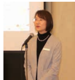
大曲副知事による意見交換会挨拶