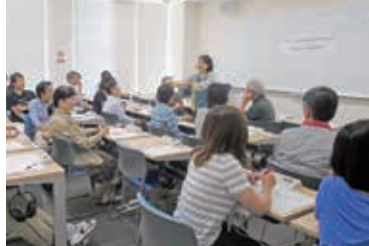
▲第2回 [Learning English through Literature]