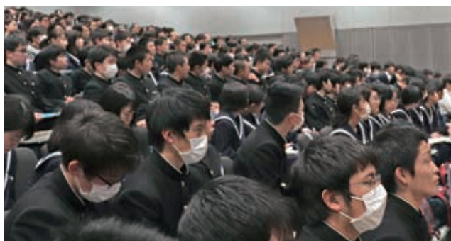
▲熱心に聞き入る高校生の皆さん