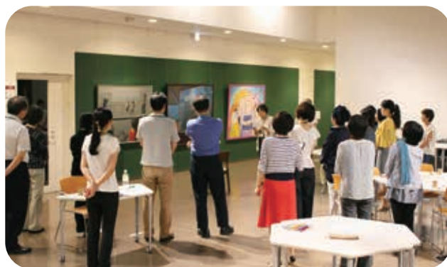
▲参加者が書いた手紙を共有する場面では、様々な思い出が溢れました