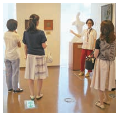
▲第5回「思考を刺激する美術鑑賞」