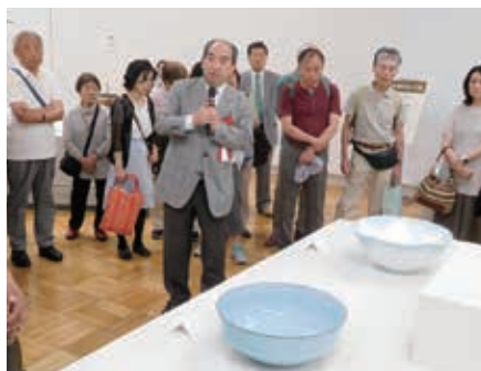
▲第3回「西部伝統工芸展ギャラリートーク」 「色鍋島と今右衛門」