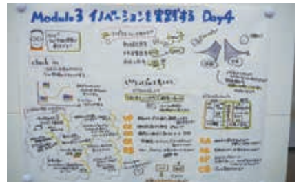
▲グラフィックレコーディングで授業を可視化