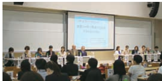
▲第二部：パネルディスカッション