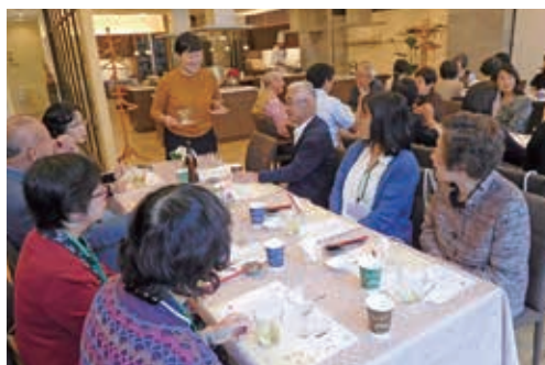
▲第10回「心も身体も潤うお家薬膳」