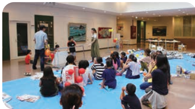
▲各グループで考えたオリジナルの演劇を全員の前で発表

後半（10月～3月）は、「障がい者とアート」をテーマに、多様性を認める社会実現に向けた文化芸術の役割を果たすアートマネジメント人材育成をめざし、宗像市と連携して「宗像市をフィールドとしたアートマネジメント講座」を開催しました。宗像市の障がい者福祉施設の協力を得て、アンケート調査やヒアリング調査を行ないました。その結果を踏まえて、平成30年度には、受講生による企画実施、あるいは政策提言を行う予定です。宗像市を一つのフィールドとして実践することで、将来的には他の自治体および他分野にも応用できるようなアートマネジメント人材の育成が期待されます。