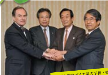
握手を交わす4大学の学長・総長 (2009年5月22日の戦略会議にて)