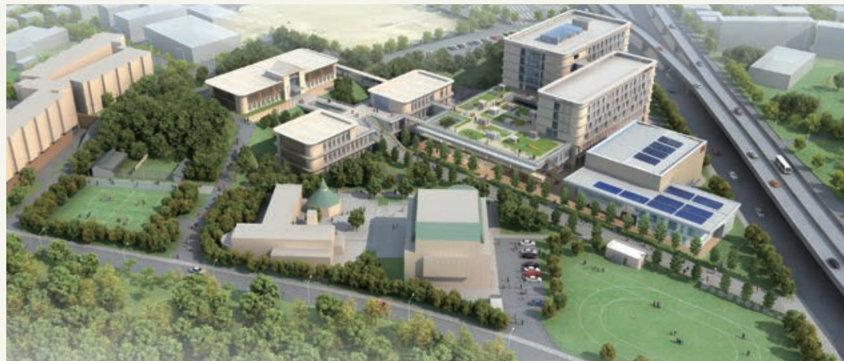
※イメージ図は基本設計における完成予想図(平成29年完成予定)です。