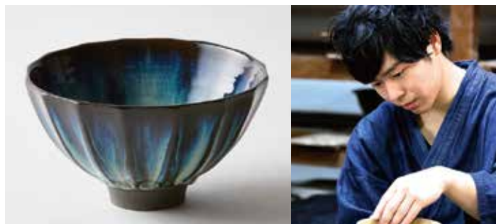
たかとりきまごうゆしのぎちやわん 高取極光釉鑄茶碗