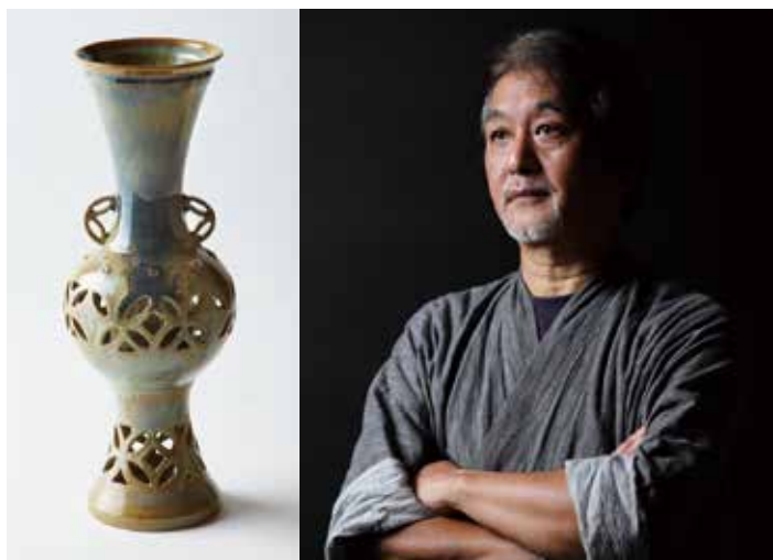
たかとりしるゆうしっぽうすかしき 高取白釉七宝透花器